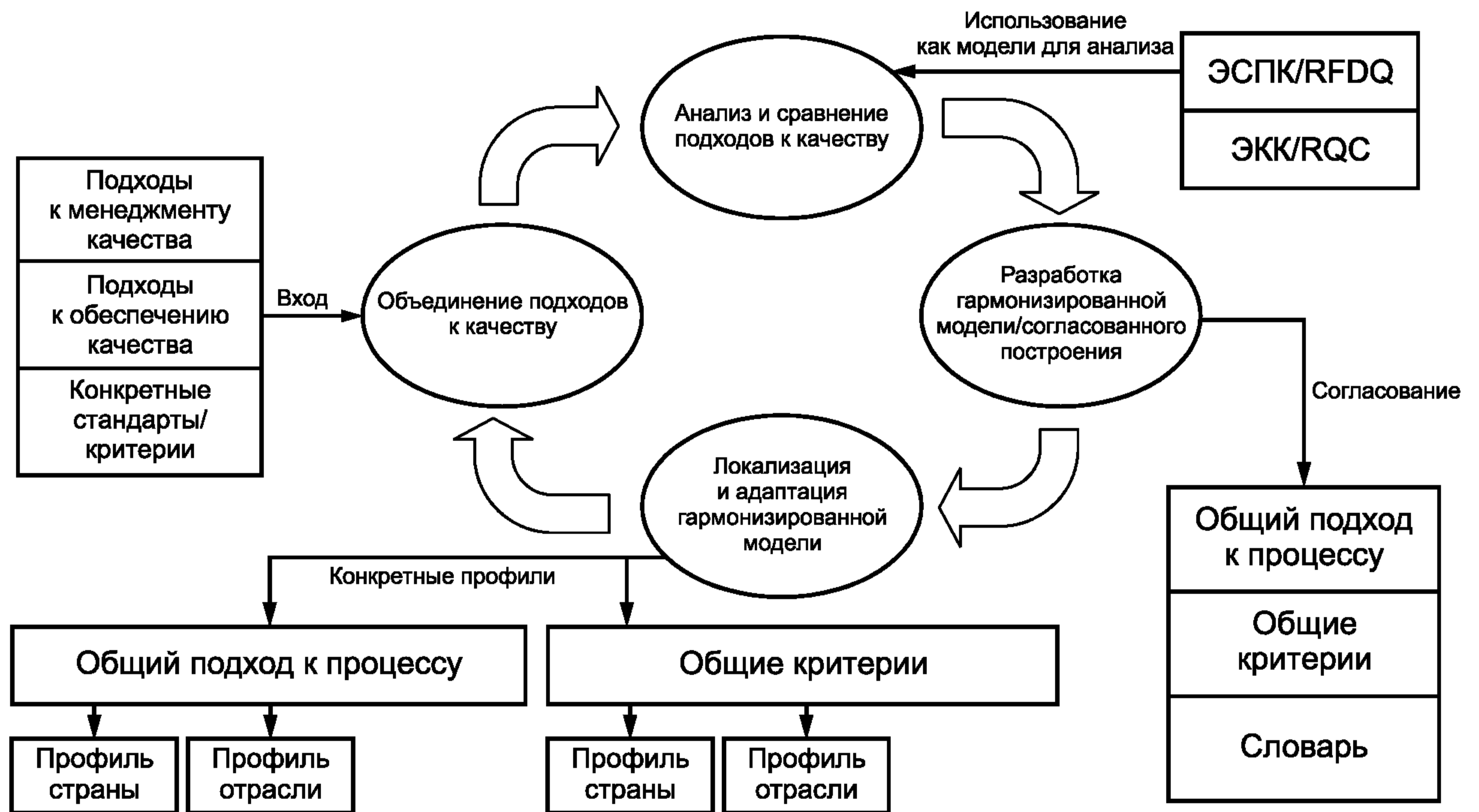
Рисунок ДА.1 — Схема разработки общего подхода к качеству в области электронного обучения

Схема разработки общего подхода к качеству в области электронного обучения приведена на рисунке ДА.1.